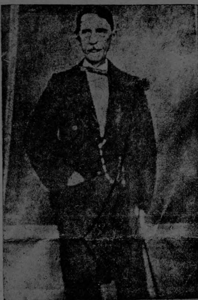
JUAN PABLO DUARTE

En la historia de la conquista y civilización de América, "La Española" ocupa puesto de honor y nosotros sus hermanos debemos repetir su nombre con veneración al cumplirse el primer centenario de su Independencia.