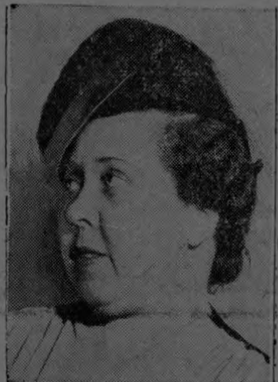
Srta. Minerva Bernardino

Nuestra gran amiga y correligionaria, Minerva Bernardino, es actualmente la Presidenta de la Comisión Interamericana de Mujeres. Por muchos años su residencia ha sido Washington, desde donde ha dirigido, con actividad y talento, el movimiento feminista de la República Dominicana. A través de ella hemos aprendido a querer a ese país y a admitir la acción resuelta y valerosa de sus mujeres y a agradecerle al Generalísimo Trujillo, su decisión inquebrantable de dar el voto a las mujeres de su patria, quienes lo ayudaron con agradecimiento illo, en las últimas elecciones del año de 1943.